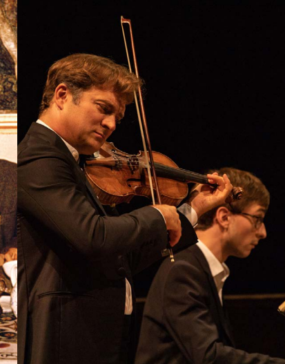
Renaud Capuçon