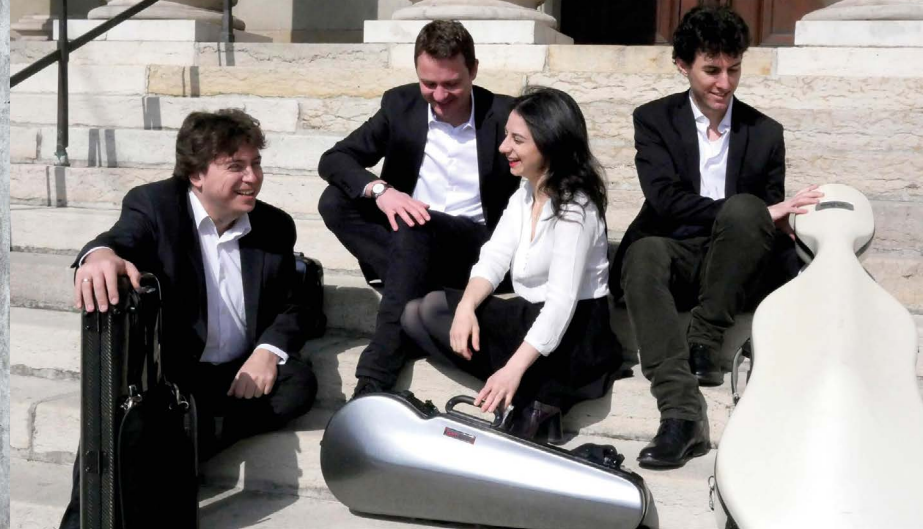
Le Quatuor Aviv