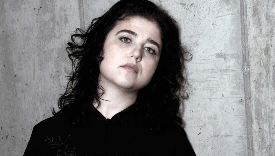
Lera Auerbach