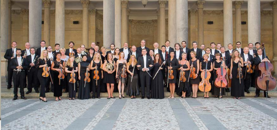
Karlovarský symfonický orchestr