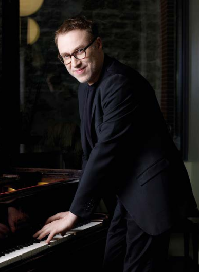
Jean-François Zygel